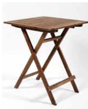
Table en Teck 70 x 70 cm 5€