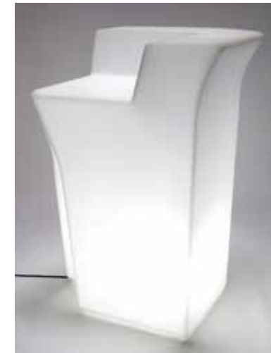
Angle de comptoir en plastique moulé lumineux - 145€