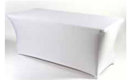
Housse pour Buffet plastique Orange, Fushia, Bleu, Blanc