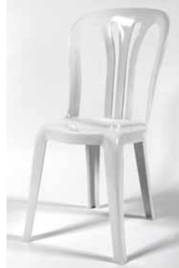
Chaise Blanche Plastique Moulé - 1€40