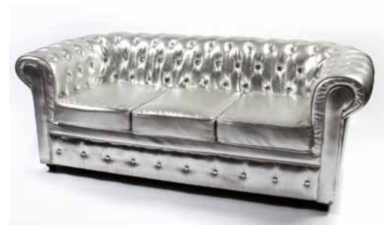
Canapé 3 places Chesterfield Argent 140€