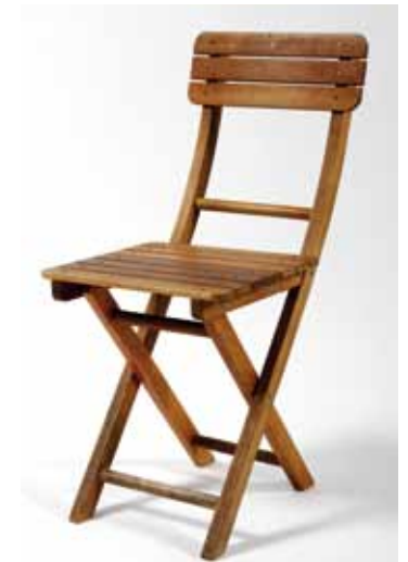
Chaise en Teck Pliante 2€