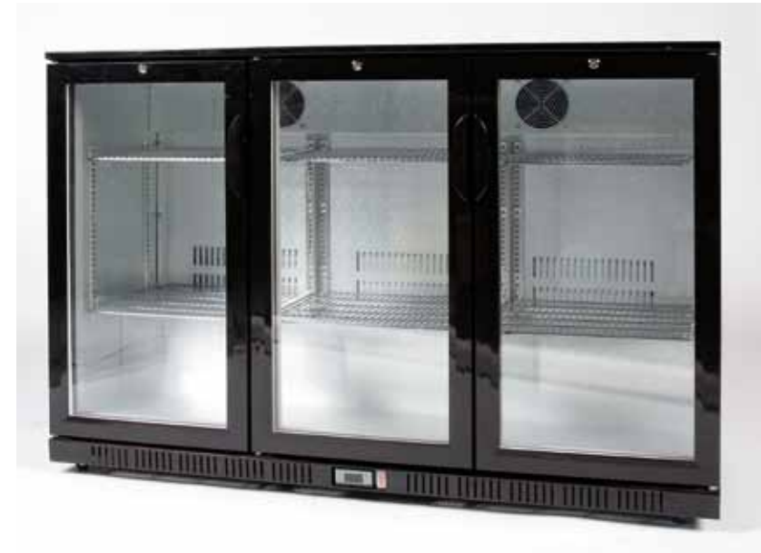
Frigo bas 220 volts - 3 portes vitrées Noir - 160€