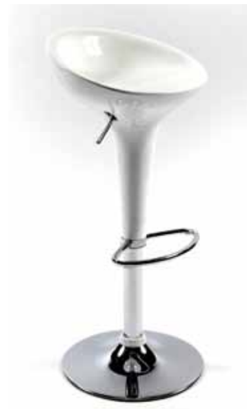
Tabouret plastique moulé blanc 25€