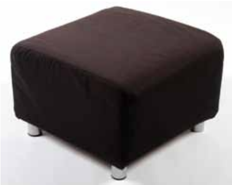
Pouf en Tissu Noir (existe en Blanc) 25€