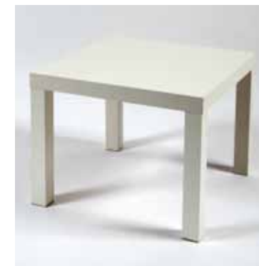
Table Basse Blanche 50 x 50 cm (existe en rouge et noir) 9€50