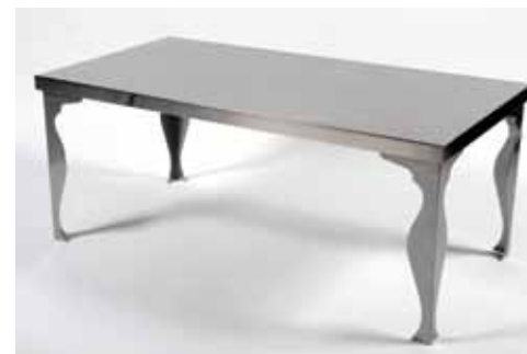
Table Basse Inox 60 x 120 cm - 25€