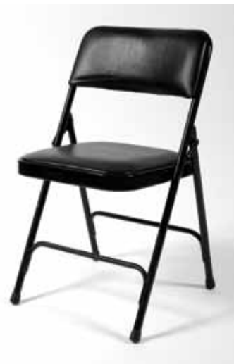
Chaise Conférence Noir 5€