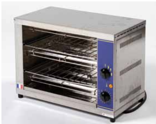
Salamandre 220 volts - 44€