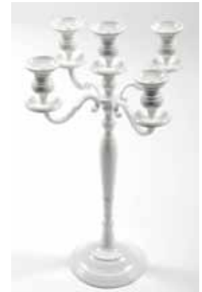
Chandelier Blanc (70 cm) - 35€