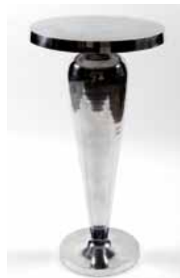
Guéridon Haut (h. 103 cm) - 155€