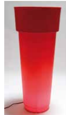
Vasque lumineuse rouge (h. 150 cm) 80€