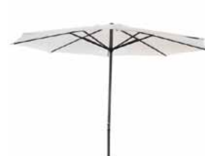
Parasol 75€ (existe en 3m50 ou 4m de diamètre)