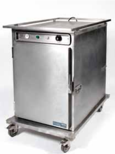
Etuve électrique 220 v (22 niveaux) - 100€