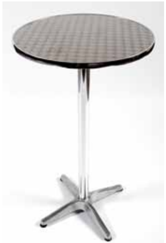
Mange debout en alu avec plateau rond (Diam 60 cm) 20€