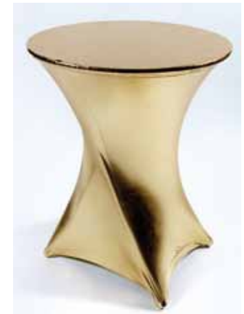
Mange debout Lycra, HT 108 cm Blanc, Argent et Or 40€