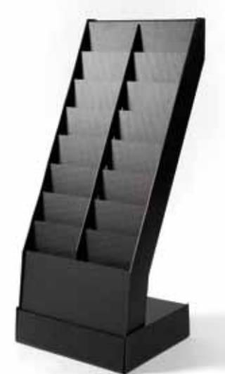
Porte document noir (h. 140 cm) - 28€