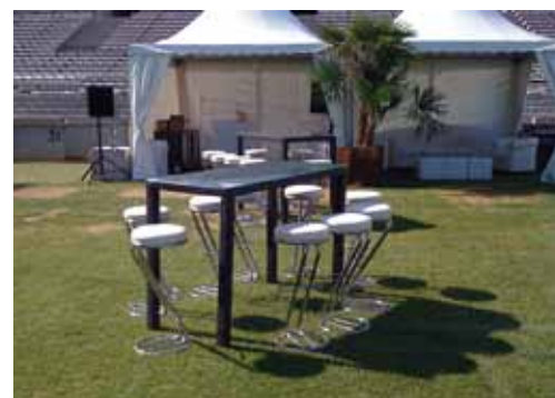
Kit Mange debout osier et tabouret