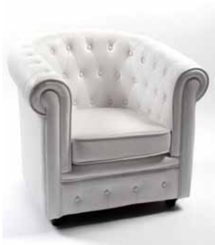
Fauteuil Chesterfield Blanc 70€