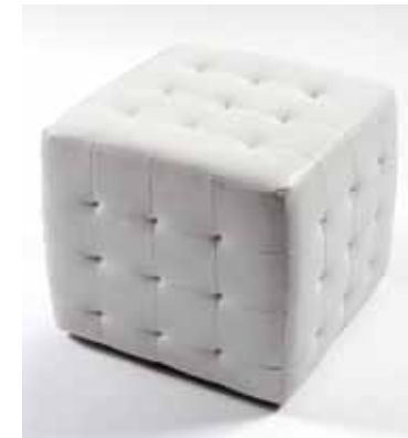
Pouf Chesterfield Blanc (50 cm x 50 cm x 50 cm) 40€