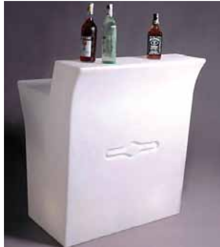
Jumbo Bar lumineux