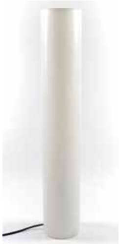
Tube lumineux (h. à partir de 150 cm, 220 v) 70€