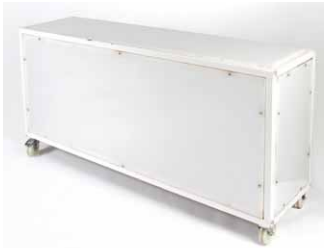
Comptoir Plexi et Fer 2M Lumineux 140€