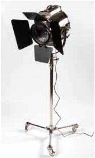
Projo MGM 220 volts (h. 180cm) - 185€