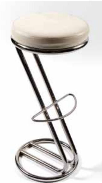
Tabouret Z Blanc 20€