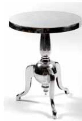
Guéridon Inox (h. 50 cm) - 55€