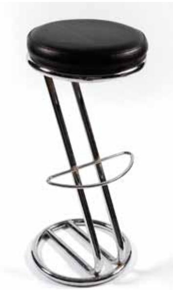
Tabouret Z Noir 20€