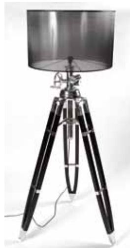
Lampe Royal Alu 220 volts (h. 182cm) - 165€