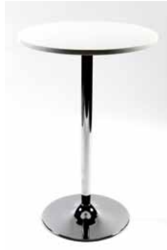
Mange debout en alu avec plateau Blanc Vanessa (Diam 70 cm) 30€