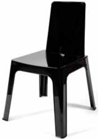
Chaise Carmen Noire Opaque - 6€