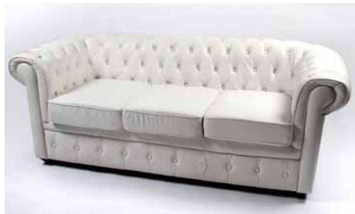
Canapé 3 Places Chesterfield Blanc 140€