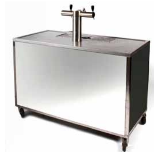
Machine à Pression 2 becs Inox - 215€