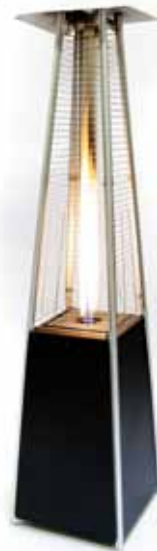
Chauffage à gaz d'extérieur Flamme 175€