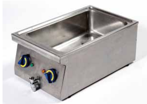
Bain Marie électrique 220 volts 20€