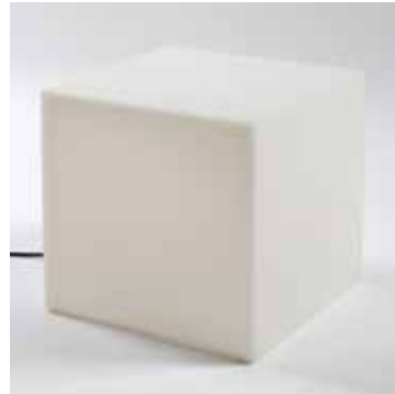
Pouf Lumineux Blanc (50 cm x 50 cm, 220 v) 50€