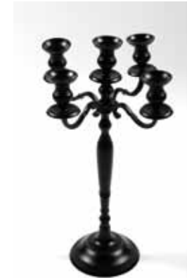
Chandelier Noir (70 cm) - 35€