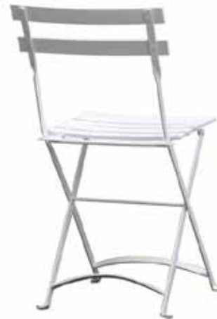
Chaise à Lattes Blanches 2€