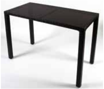
Mange debout Osier 120 x 60 cm - 35€