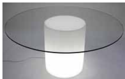
Table ronde avec pied lumineux et plateau de verre (Diam 150 cm) 80€