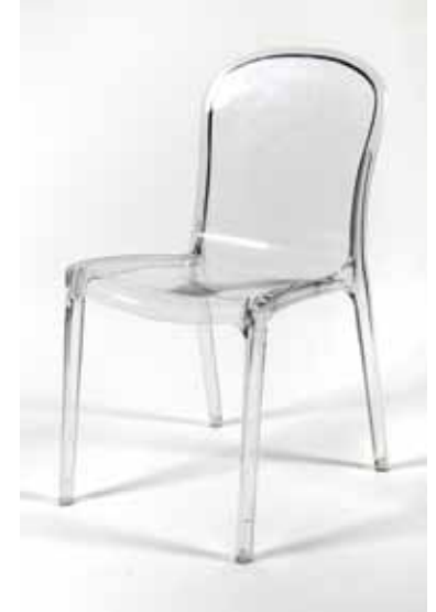
Chaise Victorine Translucide - 6€