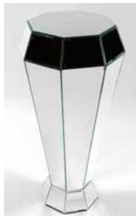
Guéridon Diamant (h. 135cm) - 105€