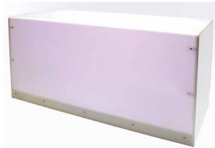
Comptoir Plexi 2M50 lumineux 250€