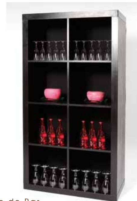
Arrière de Bar Rangement Noir ou Blanc - 45€ 12