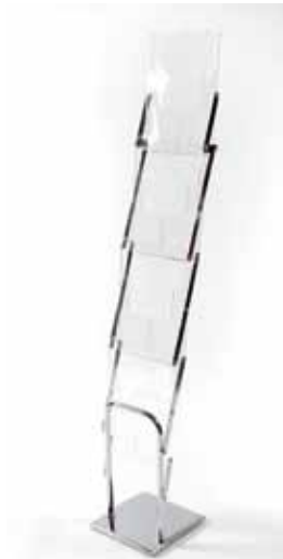
Porte document plexi (h. 140 cm) - 32€