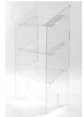
Porte document plexi 32€