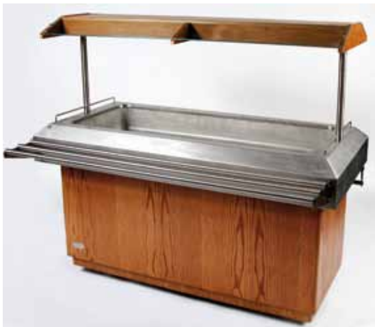
Buffet froid électrique (4 GN1/1) 220 volts 85€