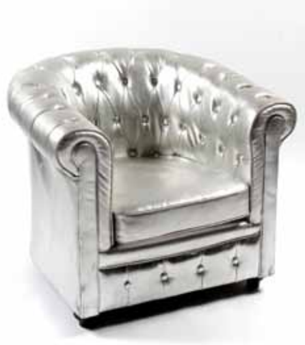
Fauteuil Chesterfield Argent 70€