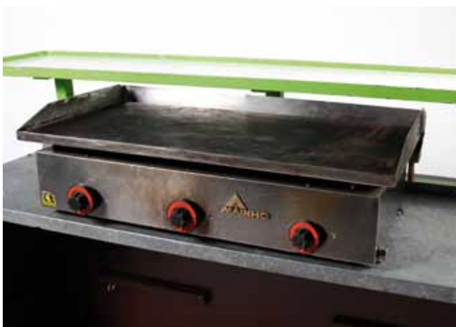
Plancha à Gaz (90 x 50 cm) - 65€