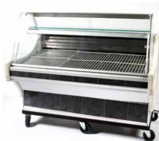
Banque froide pour Sandwich 185€