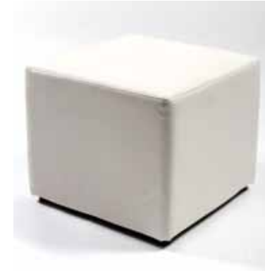
Pouf Skaï Blanc et Noir (45 cm x 45 cm x 45 cm) 30€