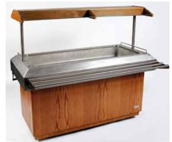
Buffet chaud électrique (4 GN1/1) 220 volts 85€