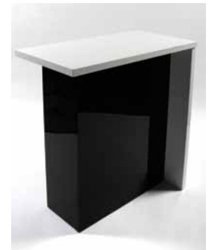
Comptoir Laqué Noir et Blanc 80€