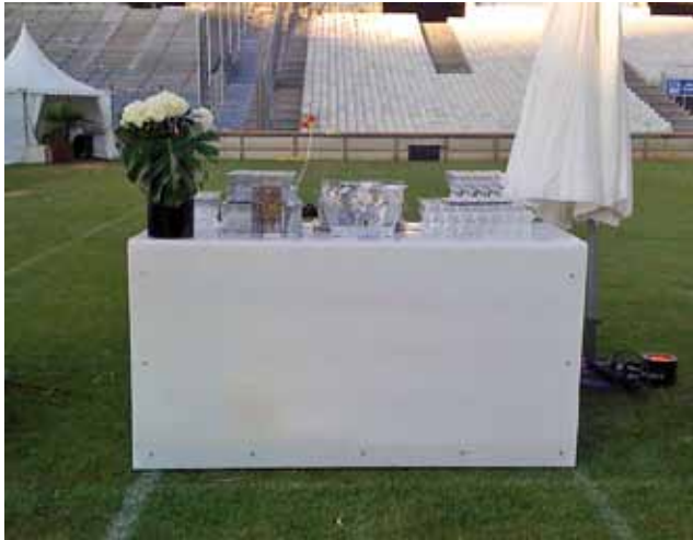
Comptoir Plexi lumineux 2M 220€