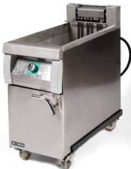
Friteuse électrique 32 ampère (30 litres) - 62€