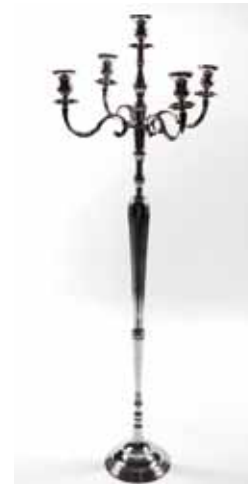
Chandelier Alu (195 cm) 95€