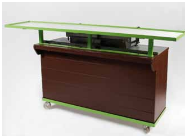
Meuble pour Plancha - 65€