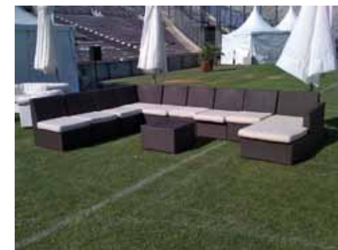
Structure osier gris 14 places - 470€