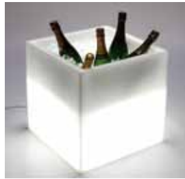
Cube lumineux creux (50 cm x 50 cm, 220 v) 20€