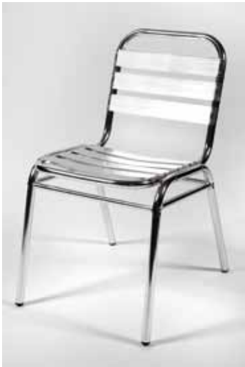
Chaise Alu Techno 3€