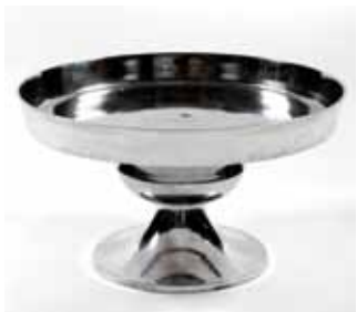
Vasque Plate Alu 65€