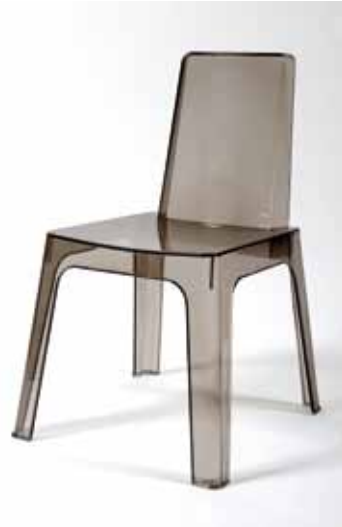
Chaise Carmen Noire Transparente - 6€