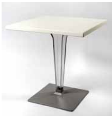
Table Calvi pied transparent et plateau Blanc ou Noir 70 x 70 cm - 20€