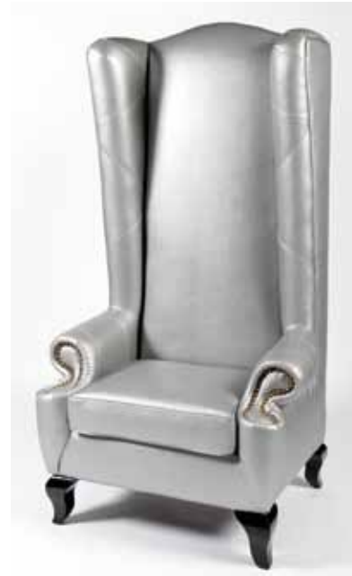
Fauteuil Baroque Gris 130€