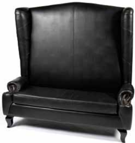
Canapé Baroque Noir 230€