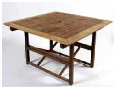
Table en Teck 110 x 110 cm 9€