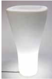
Vasque Lumineuse (h. 160 cm) 105€