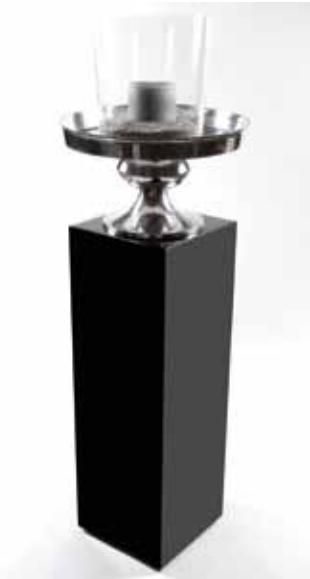
Colonne verre noire 175€