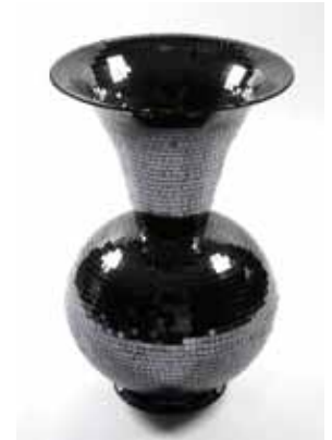
Vasque Mosaïque (h. 70 cm) 57€