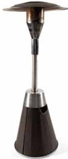
Chauffage à gaz d'extérieur pied osier gris 145€