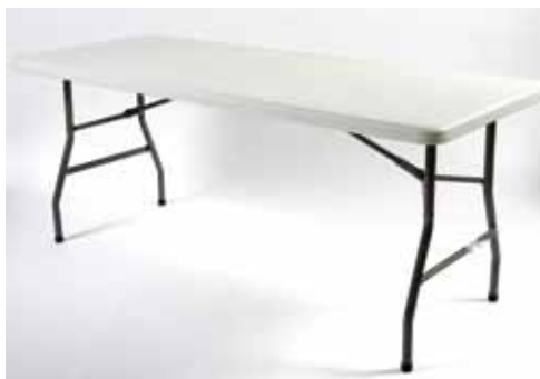
Table à Buffet plastique (183 x 76; h,80 cm) - 12€