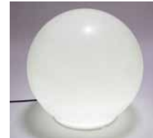
Boules Lumineuses 85€