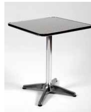
Table Alu Techno 60 x 60 cm - 10€